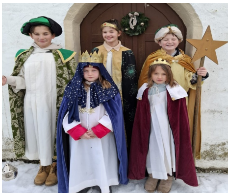
Sternsinger von Aunkofen