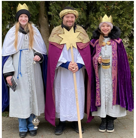
Sternsinger von Marklkofen