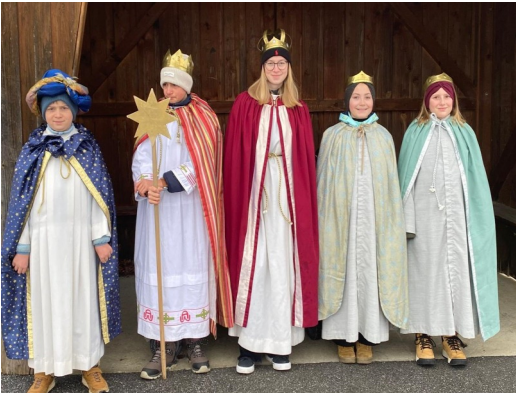
Sternsinger von Poxau