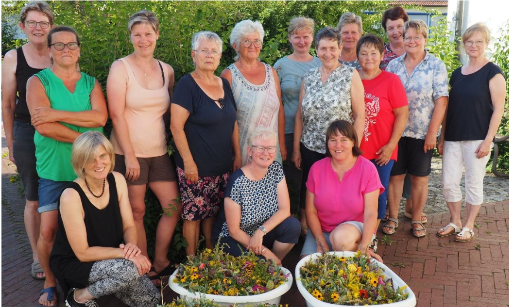
Kräuterbuschenbinden in Marklkofen