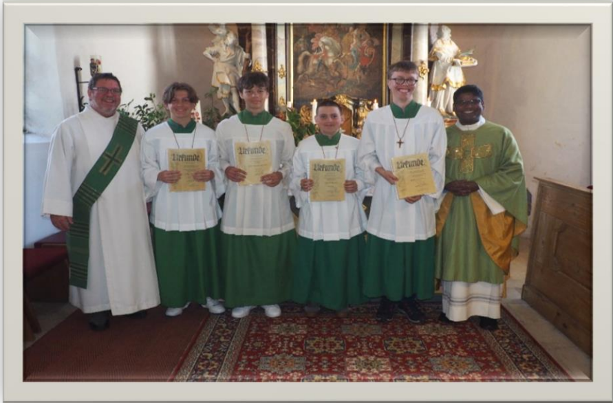
Verabschiedung Ministranten von Poxau und Marklkofen