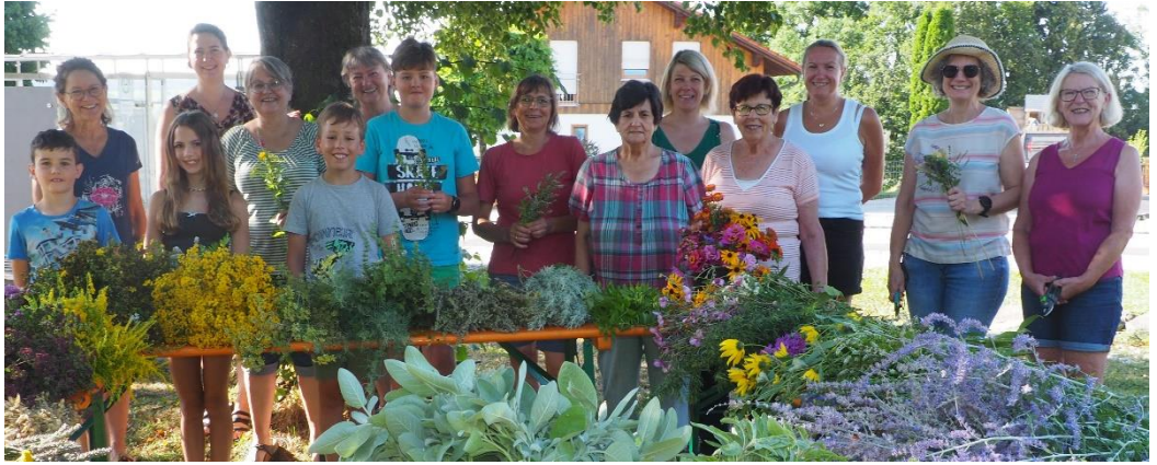
Kräuterbuschenbinden in Steinberg