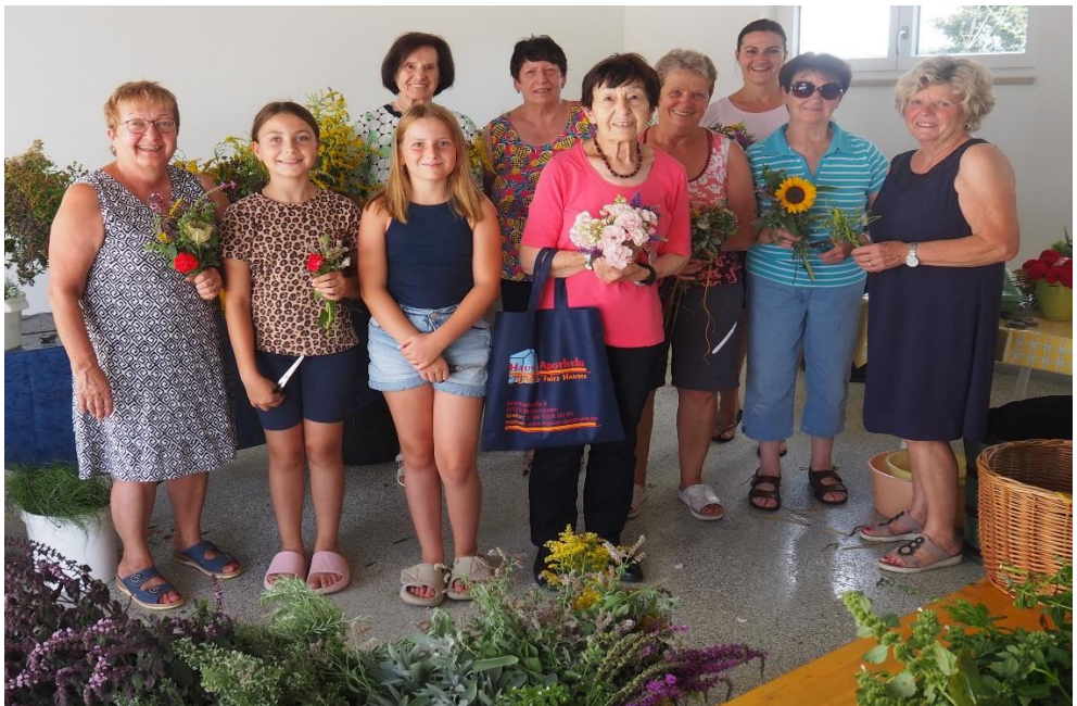
Kräuterbuschenbinden in Poxau