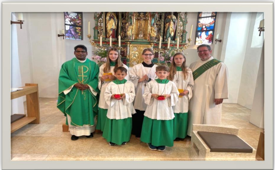
Verabschiedung und Neuaufnahme Ministranten Steinberg